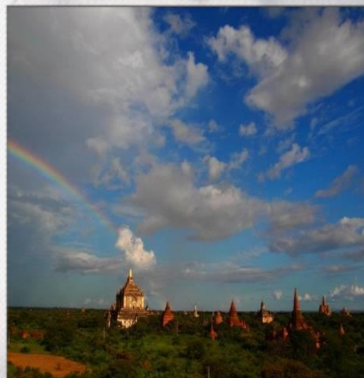
遺跡の宝庫、バガン！！